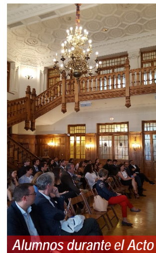
Alumnos durante el Acto