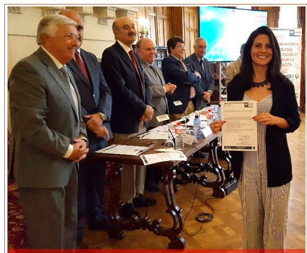
Fig. 5 Alumna durante la entrega de Certificados

De éstos, a lo largo de los 11 cursos desarrollados (2006-17), un total de 149 Arquitectos e Ingenieros , procedentes de Iberoamérica , lo han elegido para su formación de postgrado (Fig. 6). Hasta la fecha los países de procedencia de los matriculados, además de España, son los siguientes: Angola, Argentina, Bolivia, Brasil, Chile, Colombia, Costa Rica, Cuba, Ecuador, El Salvador, Guatemala, Honduras, Italia, México, Panamá, Paraguay, Perú, República Dominicana, Uruguay y Venezuela .